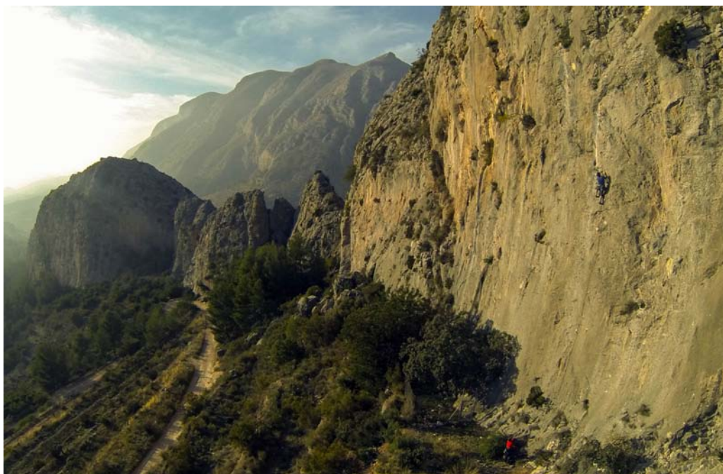
Photo / Foto / Foto: Tony Pearson, Langkofel – In Memoriam, 6b+