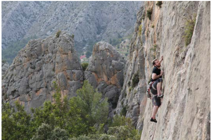
Photo / Foto / Foto: Boris Küntzler, Langkofel – In Memoriam, 6b+ Photographer / Fotograf / Fotógrafo: Joerg Beigang

Cómo llegar: Hay un estacionamiento en el terreno de la Casa Toni en el área de La Moleta. También se puede estacionar en los estacionamientos asignados por al escuela de Sella y caminar hasta el sector “Final” como está explicado por el guía de Rockfax. Sigue por la carretera pasando un pequeño bosque de Pinos a la izquierda. Después dobla a la izquierda siguiendo un camino que te lleva al inicio del sector por la vía “Piss on a Pooch”, 6b+.